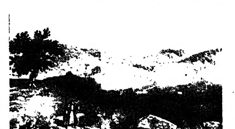
مدينة الخليل، وقد زارها ابن بطوطه وصلى في حرمها الابراهيمي الشريف...

اعزم شاب في الثمانين والمشرين من عمره، ولد في مدينة «لوانا» وشيخا في «طنجة» بالمغرب الأقصى، اعتمر ان يقدي القرينة الخامسة، وهي الحج الى بيت الله الحرام، فخرج من بلنسية في الثاني عشر من شهر رجب عام ٧٢٥ هـ لتقطع تلك الرحلة الطويلة المرحمة. ولم يكن يقدي انه سيبقى عن اقله وانامره خيسا وعشرين سنة، او تزيد، وانه سيميل الى اضرار لم يعلم عنها اهل المغرب الا اسماءها.. ولا عاد واخذ سعدت الى اللين قابلهم من غراب مسا شاهد، ومن التسويب التي اختط بها